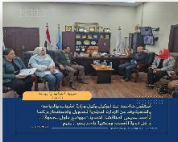
جمعية الشباب والرياضة القاهرة