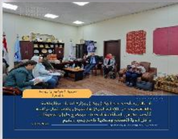
جمعية الشباب والرياضة القاهرة